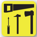
Herramientas utilizadas como armas punzantes o cortantes Tools used as stabbing or cutting weapons