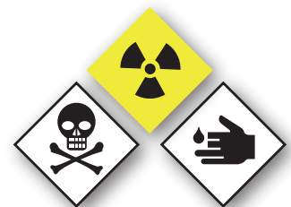
Sustancias químicas y tóxicas Chemical and toxic substances