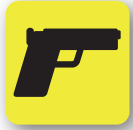
Armas de fuego Firearms