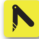
Objetos punzantes o con filo Sharp or bladed objects