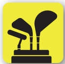
Objetos contundentes Blunt objects