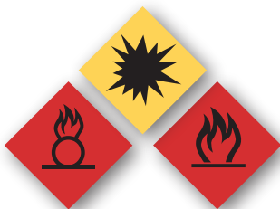
Sustancias explosivas e inflamables Explosive and flammable substances