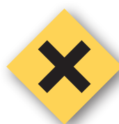
Artículos peligrosos Dangerous items